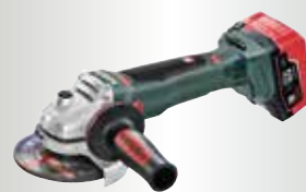
WB 18 LTX BL 125 Quick