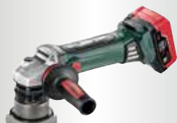
KFM 18 LTX 3 RF