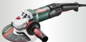
WE 19-180 Quick RT