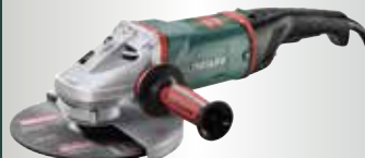
WEA 26-230 MVT Quick