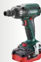
SSW 18 LTX 400 BL