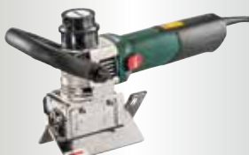
KFM 15-10 F