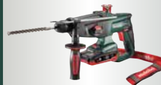
KHA 18 LTX

További fémmegmunkáló gépeket a metabo.com honlapon találhat.