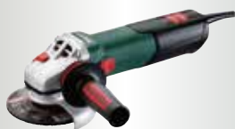
WEV 17-125 Quick