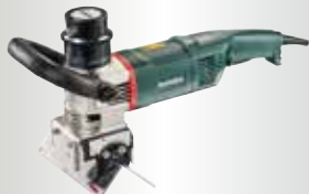
KFM 16-15 F