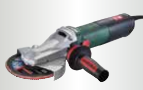
WEF 15-105 Quick